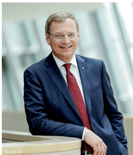
Landeshauptmann Mag. Thomas Stelzer