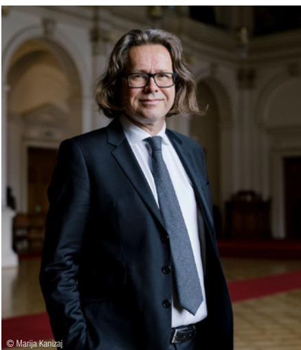
Bundesminister für Bildung Ao. Univ.-Prof. Mag. Dr. Martin Polaschek

Danke für Ihren tagtäglichen Einsatz für die Menschen und unser Land!